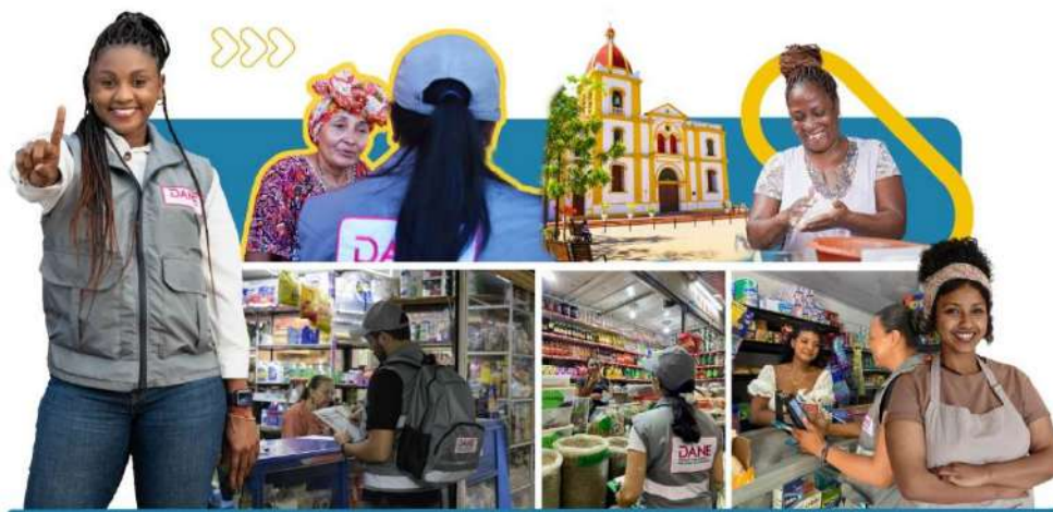
Ilustración 1. DANE 2025

Por otro lado, el capítulo de la informalidad ha sido una preocupación continua de los diferentes gobiernos en los distintos niveles.