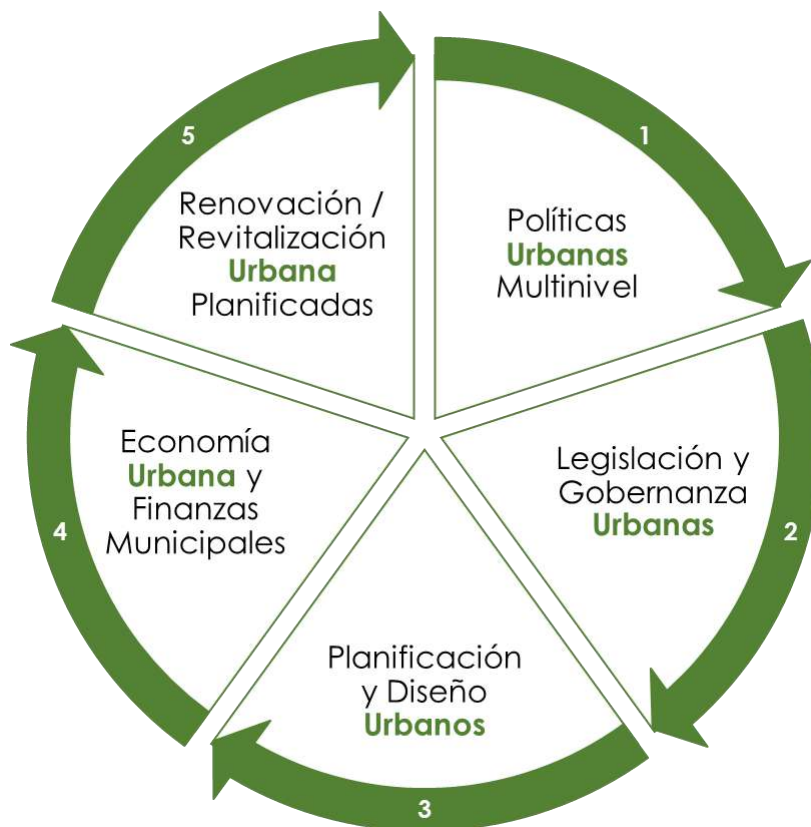
Ilustración 2. Nueva Agenda Urbana 2021

Todo este contexto previo, denota como el Desarrollo urbano sostenible está directamente ligado al Desarrollo económico en nuestras ciudades capitales, entre otras, a través de múltiples variables (que identificaremos e iremos organizando en esta y nuevas versiones de este documento), y a diferentes estrategias que deberían ser abordadas por los diferentes niveles de gobiernos. Para ello, y acorde con la recomendación que nos hace la NAU, se hace necesario delimitar los ejes fundamentales de trabajo conjunto para garantizar alineación y coordinación oportuna entre la nación, los departamento, distritos y municipios, y hasta esquemas asociativos. Estos ejes son: