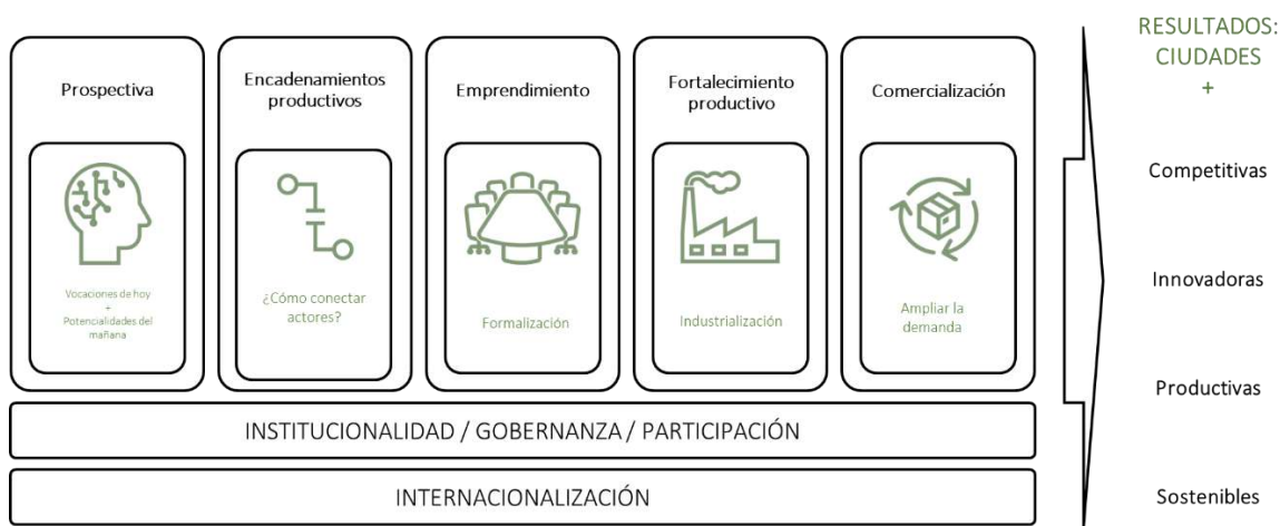
Ilustración 5. Cadena de valor de DE_3

6. La institucionalidad, 7. la gobernanza y 8. la participación, son elementos fundamentales sin los cuales esta cadena puede llevarse a buen término. Para ello: